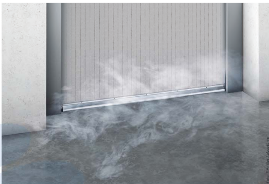
SmokeGuard verhindert das Eindringen von Rauch in den Schacht. SmokeGuard prevents smoke penetrating the shaft.

Meiller offers fire-tested landing doors according to EN 81-58 (E120) in the form SmokeGuard in combination with a smoke-proof curtain made of a special tested material. In the event of fire,