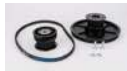
Set Riemenscheiben + Riemen