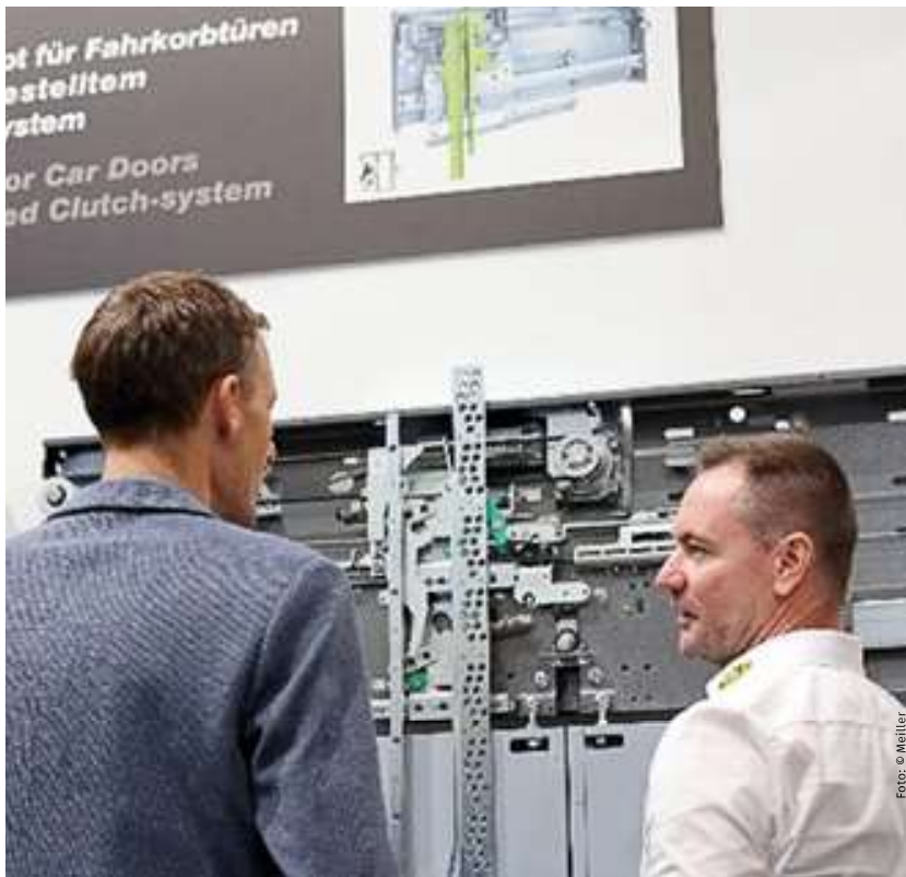
Ständen im Mittelpunkt: Die MOD-Lösungen für Fahrkorb- und Schachttüren / The focus was on the MOD solutions for car and landing doors

The Meiller technicians developed an analogous modernisation concept for landing doors as well. This makes it possible to leave existing, often elaborately configured access portals as they are while only the worn-out mechanical parts are