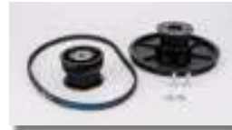
Set pulleys + belt