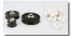
Rollers in several sizes and guide shoes 3146

Gläserenstraße 20 · 8142 Uitikon/Zürich Phone +41 44 4923666 info@zagro.ch · www.zagro.ch