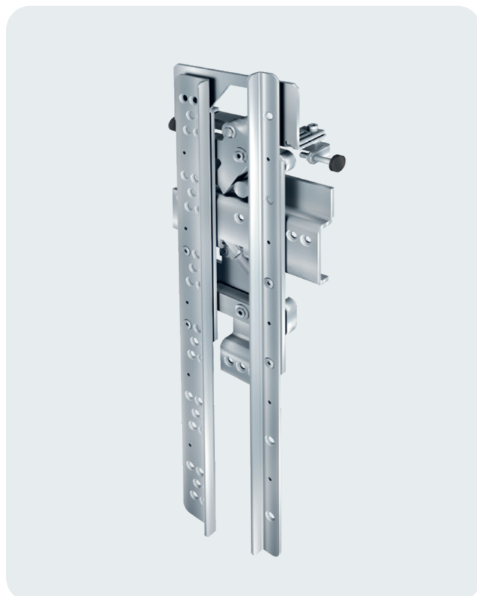
Opérateur avec sabre pinçant