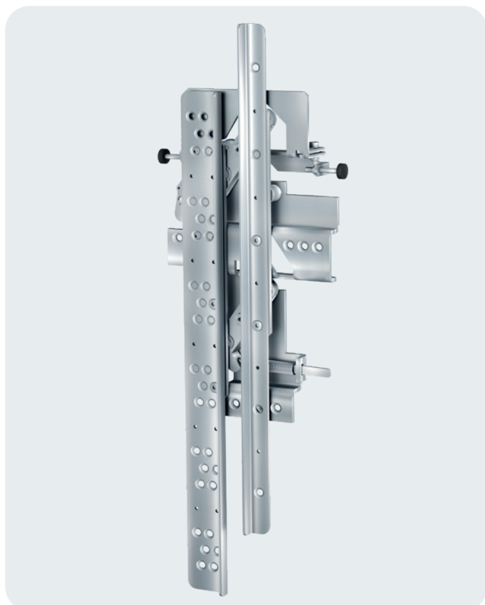
Opérateur avec sabre ouvrant